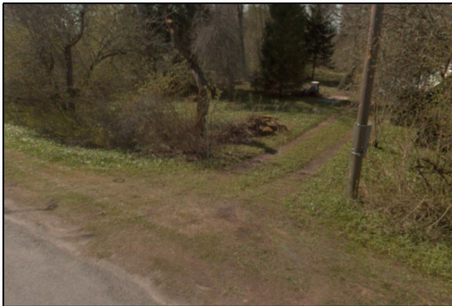
Joonis 2. Riigitee km 0,30 olemasoleva ristumiskoha asukoht (väljavõte teevideost aprill 2025)

Esitatud projekti alusel nähtub, et huvitatud isik on otsustanud uut ristumiskohta mitte rajada, vaid kasutusele võtta olemasolev ristumiskoht riigitee km 0,30. Tulenevalt sellest, et kõnealuse ristumiskoha kasutus on seni olnud vähene või ebaregulaarne, on see aja jooksul kinni kasvanud (vt joonis 2 ).